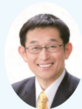
明石市長 (弁護士・社会福祉士)